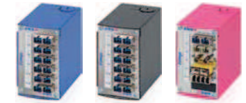
Verschiedene Gehäusefarben und Kupplungsvarianten